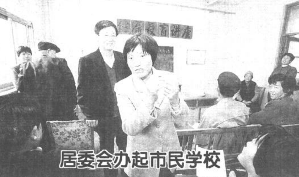
居委会办起市民学校

本报讯 3月31日，全市质量工作会议召开，传达贯彻全省质量工作会议精神，研究部署我市的质量工作。副市长谭成义出席会议并讲话，提出全市质量工作任务，要求各级政府、各有关部门和企业进一步提高对质量工作重要性的认识，采取有效措施推动全市质量工作。 谭成义说，面对我国即将加入WTO的新形势，我们要进一步增强做好质量工作的强烈意识。质量问题不仅仅是一个经济问题，也是一个政治问题，质量工作涉及经济社会生活的方方面面，关系千家万户的切身利益，是国民经济和社会发展的重要基础性工作。抓好质量工作是企业适应市场经济，走向国际市场的要求；是提高企业素质增强工业质量的必要条件；是维护消费者合法权益，对人民群众高度负责的具体体现。谭成义指出，要突出重点，不断把全市质量工作推向新水平。为此，要进一步抓好提高产品质量的基础性工作，切实消灭无标准生产；积极鼓励企业采用国际标准和国外先进标准；切实加强计量检测体系建设，完善计量检测手段，严格对计量设备的定期检定；加大力度，严厉打击制售假冒伪劣行为，整顿市场秩序，规范市场行为；加快推进质量体系认证和产品质量保证体系认证工作；抓好工程建设质量和服务质量。谭成义要求，要切实加强对质量工作的领导，实行产品质量和打假工作行政领导责任制；各级各有关部门要按照各自分工，各司其职，各负其责，积极支持配合搞好质量和打假工作；质量技术监督部门要担负起责任，做好组织、协调、指导监督工作，发挥部门优势，积极为招商引资搞好服务。（段东升 锡勇波）