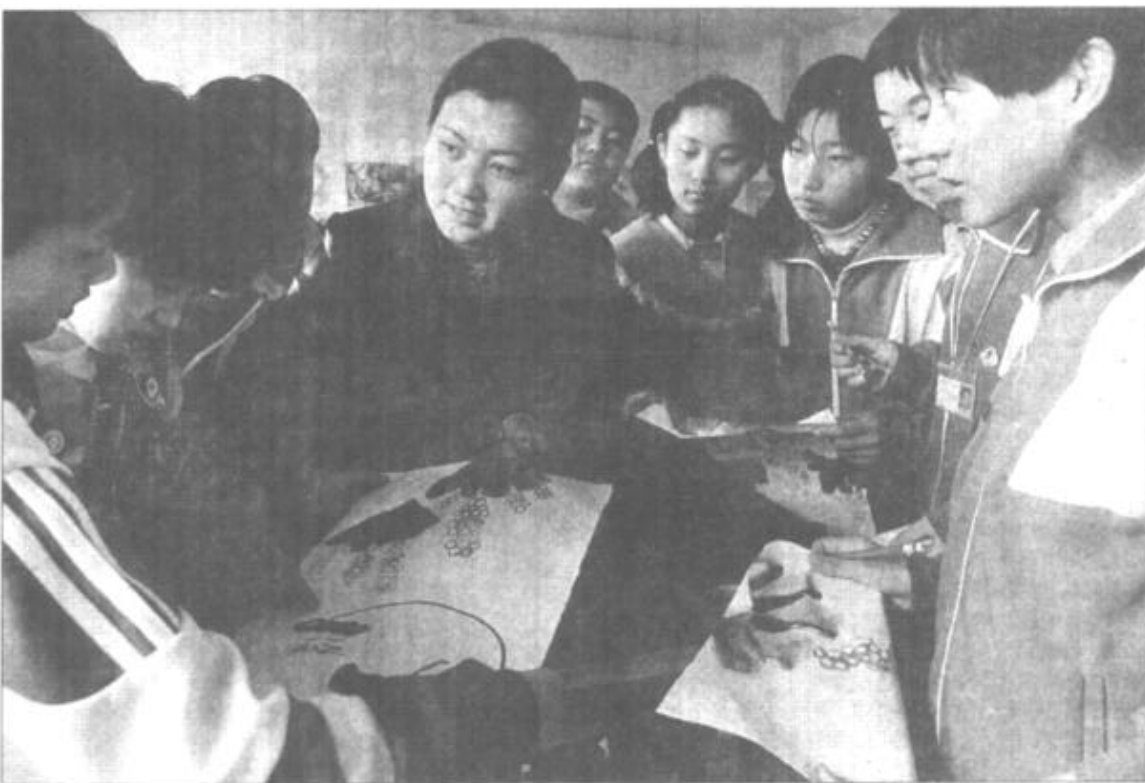
垦利县实验中学从提高学生综合素质、培养学生个性发展入手，积极开展学生减负工作。