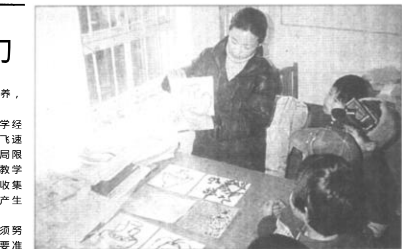
广饶县石村镇把学生“减负”作为促进素质教育的切入点来抓，广泛开设兴趣课，使学生们在德、智、体、美、劳各方面得到了全面发展。

东营区牛庄镇中心小学强化素质教育，开展丰富多彩的课外活动，努力培养学生的创新精神及实践能力。